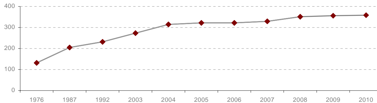
AMARRES DE USO DEPORTIVO EN ESPAÑA 1976-2010