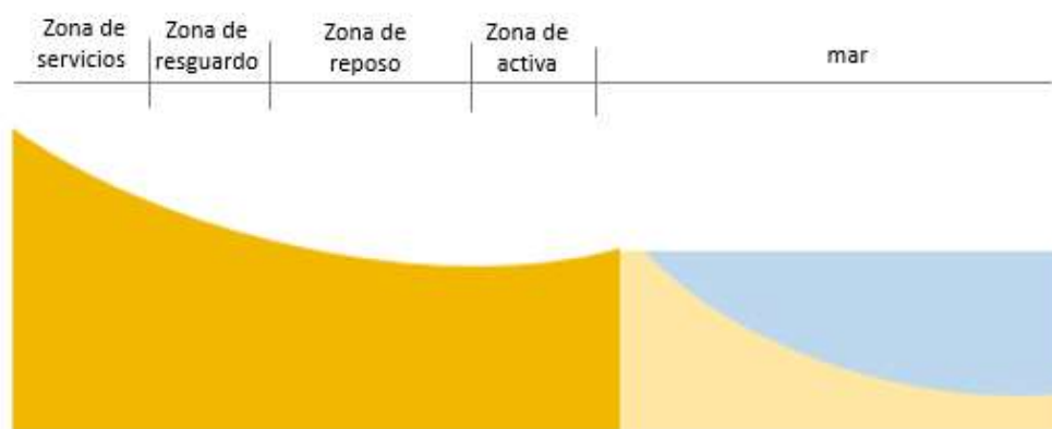
Figura 1: Ejemplo de zonificación en una playa de litoral

Para cuantificar la limitación, el ente gestor debería partir del Aforo Bruto de la playa, el cual debe tomar como variables, las características de la playa, zonificación por usos, ocupación estática y dinámica segura, tipo de ocupación de la playa, separación de accesos y de pasillos intermedios, etc.